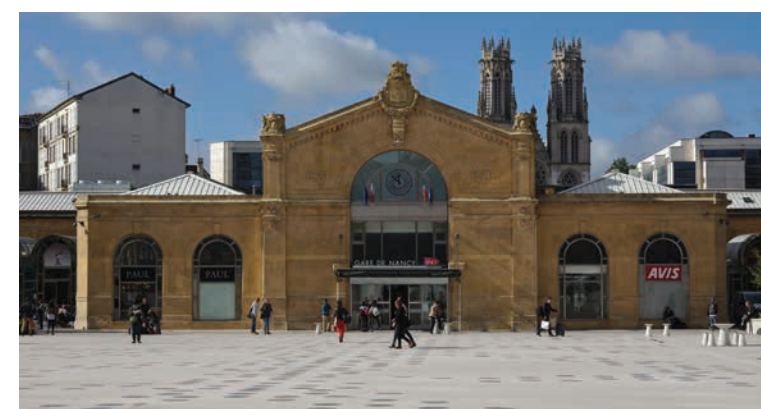
Gare de Nancy