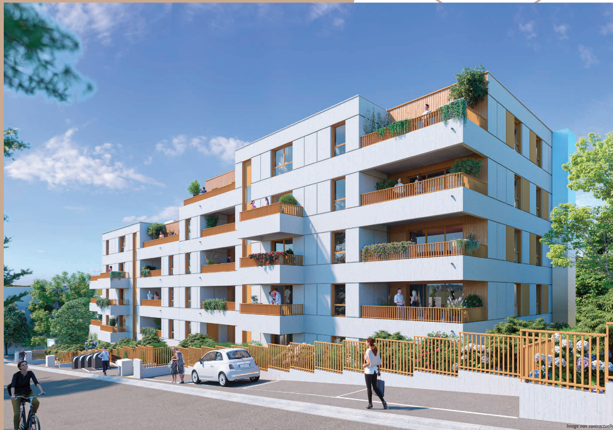
Image non contractuelle