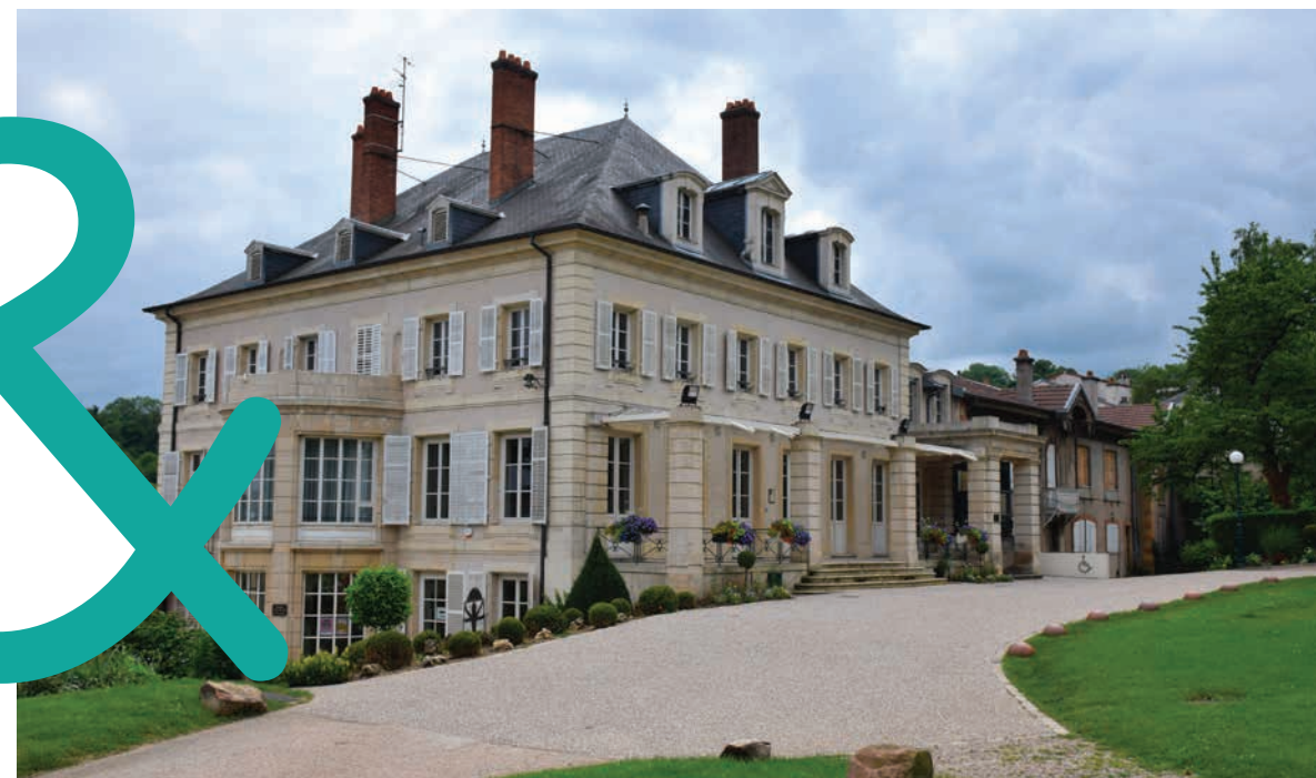
Château de Graffigny

Sur les hauteurs de Nancy , la réputation de Villers-lès-Nancy n'est plus à faire. Connue comme la ville aux 7 châteaux , reconnue pour son jardin botanique, le parc du Brabois ou encore la forêt de Haye, la ville est l'une des plus prisées de la métropole nancéienne. Hormis son patrimoine historique et naturel exceptionnel, Villers-lès-Nancy dispose de nombreux atouts. Ses équipements scolaires de qualité, de la crèche au lycée, sont très appréciés des familles et, avec la proximité des facultés, de l'hôpital universitaire et des grandes écoles, elle séduit de nombreux étudiants. Parfaitement intégrée au réseau de transports de la Métropole du Grand Nancy , Villers-lès-Nancy est naturellement la commune de prédilection pour ceux qui souhaitent vivre au vert tout en restant connecté à l'ensemble de l'agglomération.