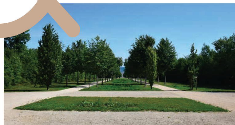
Parc de Brabois