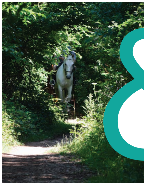
Forêt de Haye