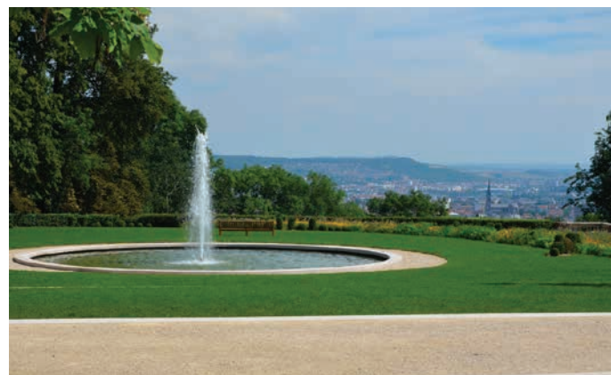
Parc de Brabois

Sur les hauteurs de Nancy , la réputation de Villers-lès-Nancy n'est plus à faire. Connue comme la ville aux 7 châteaux , reconnue pour son jardin botanique, le parc du Brabois ou encore la forêt de Haye, la ville est l'une des plus prisées de la métropole nancéienne. Hormis son patrimoine historique et naturel exceptionnel, Villers-lès-Nancy dispose de nombreux atouts. Ses équipements scolaires de qualité, de la crèche au lycée, sont très appréciés des familles et, avec la proximité des facultés, de l'hôpital universitaire et des grandes écoles, elle séduit de nombreux étudiants. Parfaitement intégrée au réseau de transports de la Métropole du Grand Nancy , Villers-lès-Nancy est naturellement la commune de prédilection pour ceux qui souhaitent vivre au vert tout en restant connecté à l'ensemble de l'agglomération.