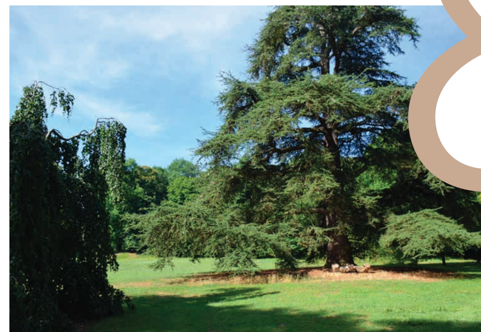
Parc de Rémicourt